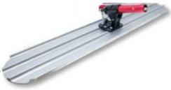
Grande Taloche Magnesium 122X20 avec raccord Rock It