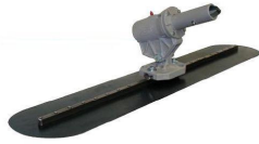
Lisseuse Fer 91x120 mm avec raccord Rock It